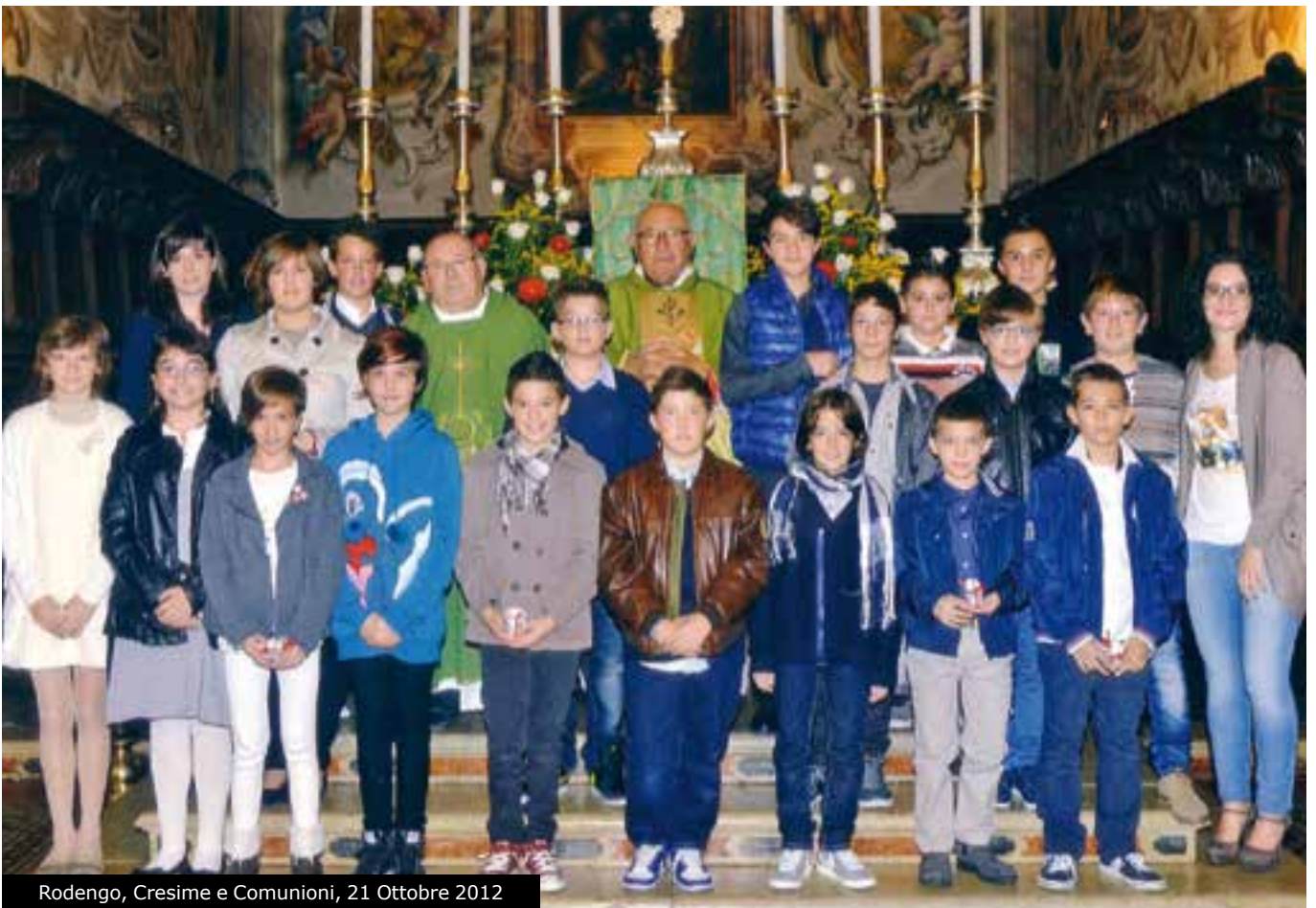
Rodengo, Cresime e Comunioni, 21 Ottobre 2012