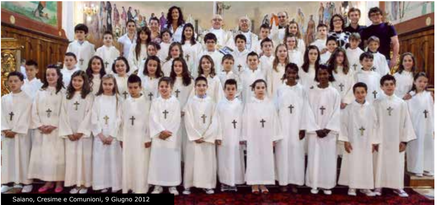
Saiano, Cresime e Comunioni, 9 Giugno 2012