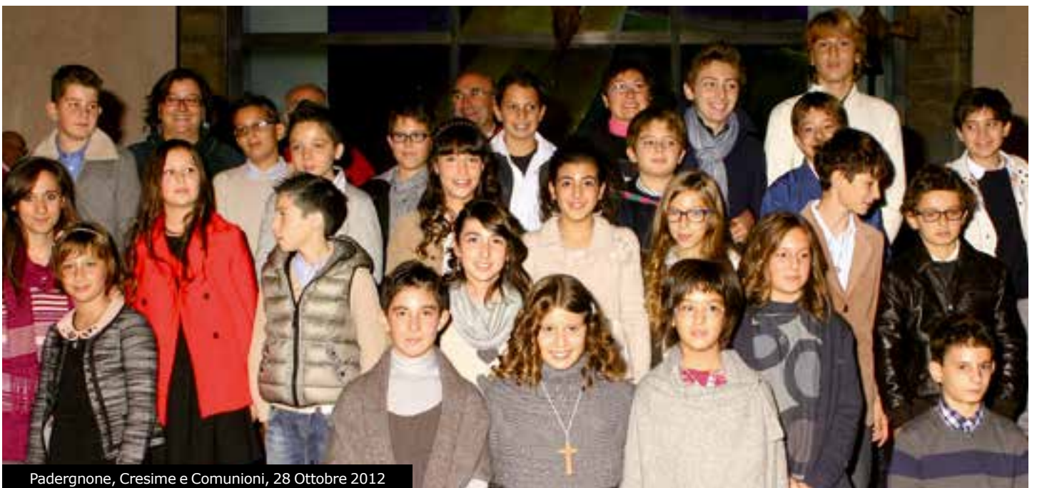
Padergnone, Cresime e Comunioni, 28 Ottobre 2012