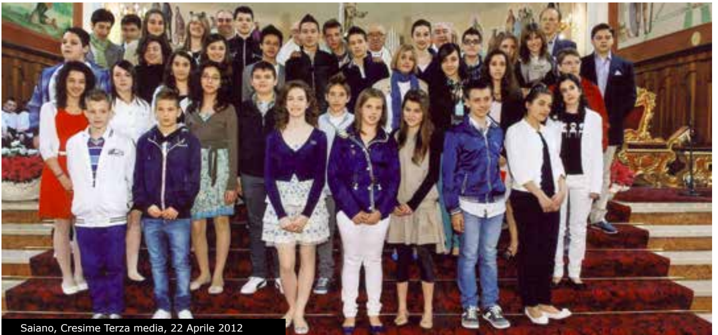
Saiano, Cresime Terza media, 22 Aprile 2012