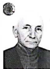
Cola Paolo anni 80