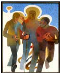
ARCABAS - I pellegrini di Emmaus - Polittico / 1° "Sulla strada" Chiesa della Resurrezione - Comunità Nazareth - Torre de' Roveri (Bg) Per gentile concessione dell'autore