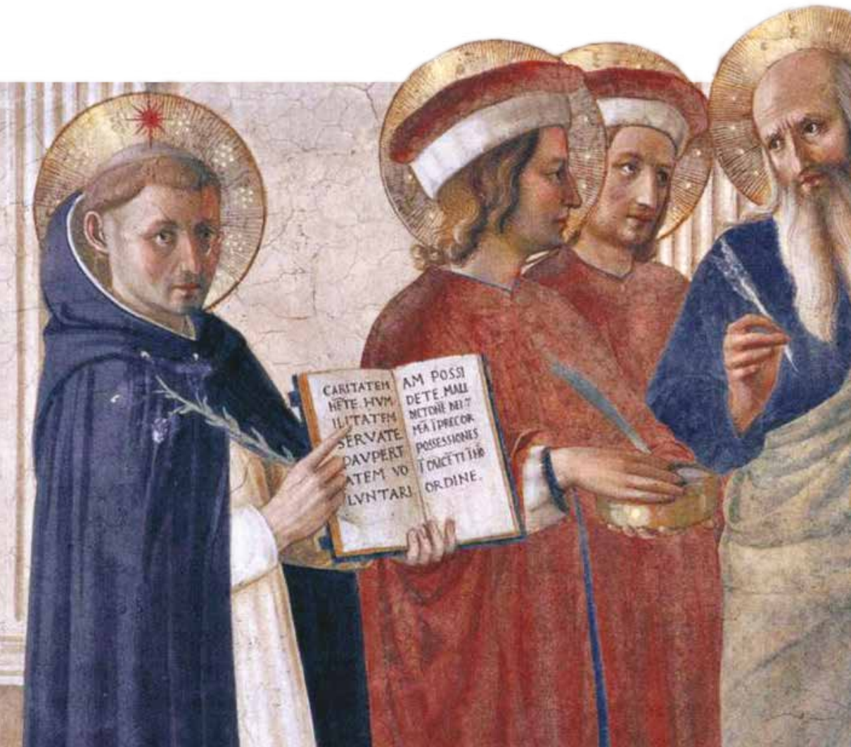
BEATO ANGELICO, Madonna delle ombre - Sacra conversazione (particolare) , 1440-1450, Firenze, Convento di S. Marco.