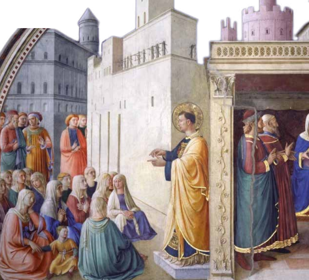
BEATO ANGELICO, Predica di santo Stefano e disputa nel Sinedrio , 1447-1448, Vaticano, Cappella Niccolina.