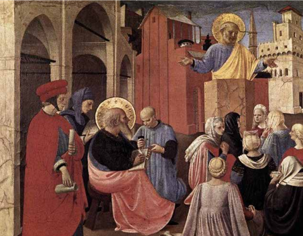
BEATO ANGELICO, Predica di San Pietro alla presenza di S. Marco (predella), 1434-1435, Firenze, Convento di San Marco.