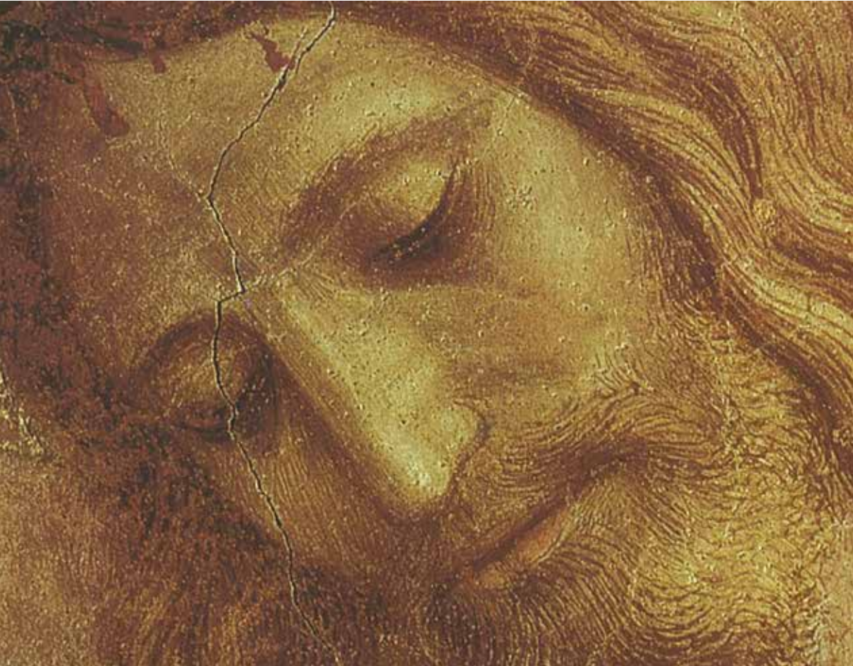
BEATO ANGELICO, San Domenico adorante il Crocifisso (particolare), 1438-1446, Firenze, Convento di San Marco.