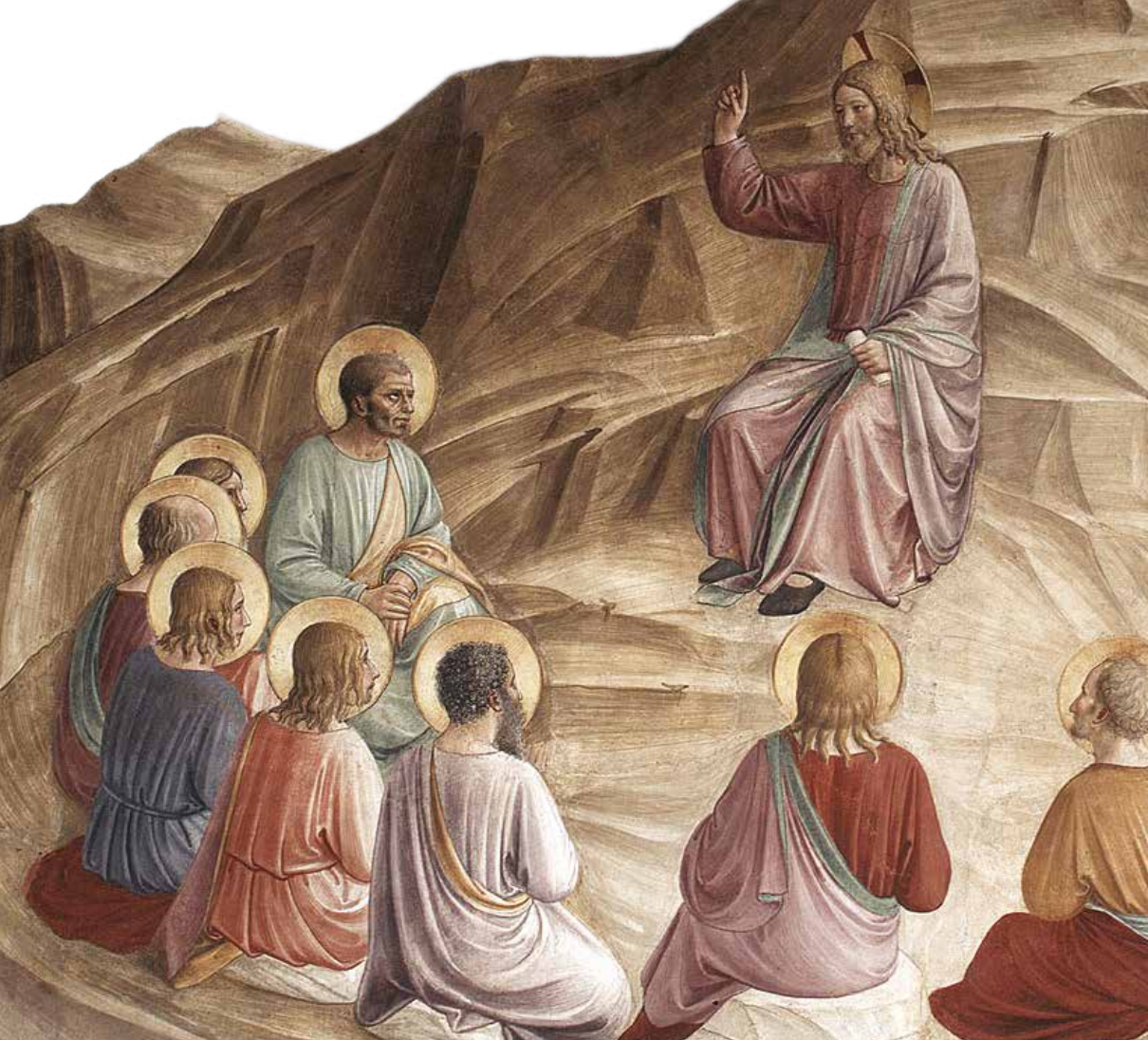
BEATO ANGELICO, Discorso della montagna , 1438-1440, Firenze, Convento di San Marco.