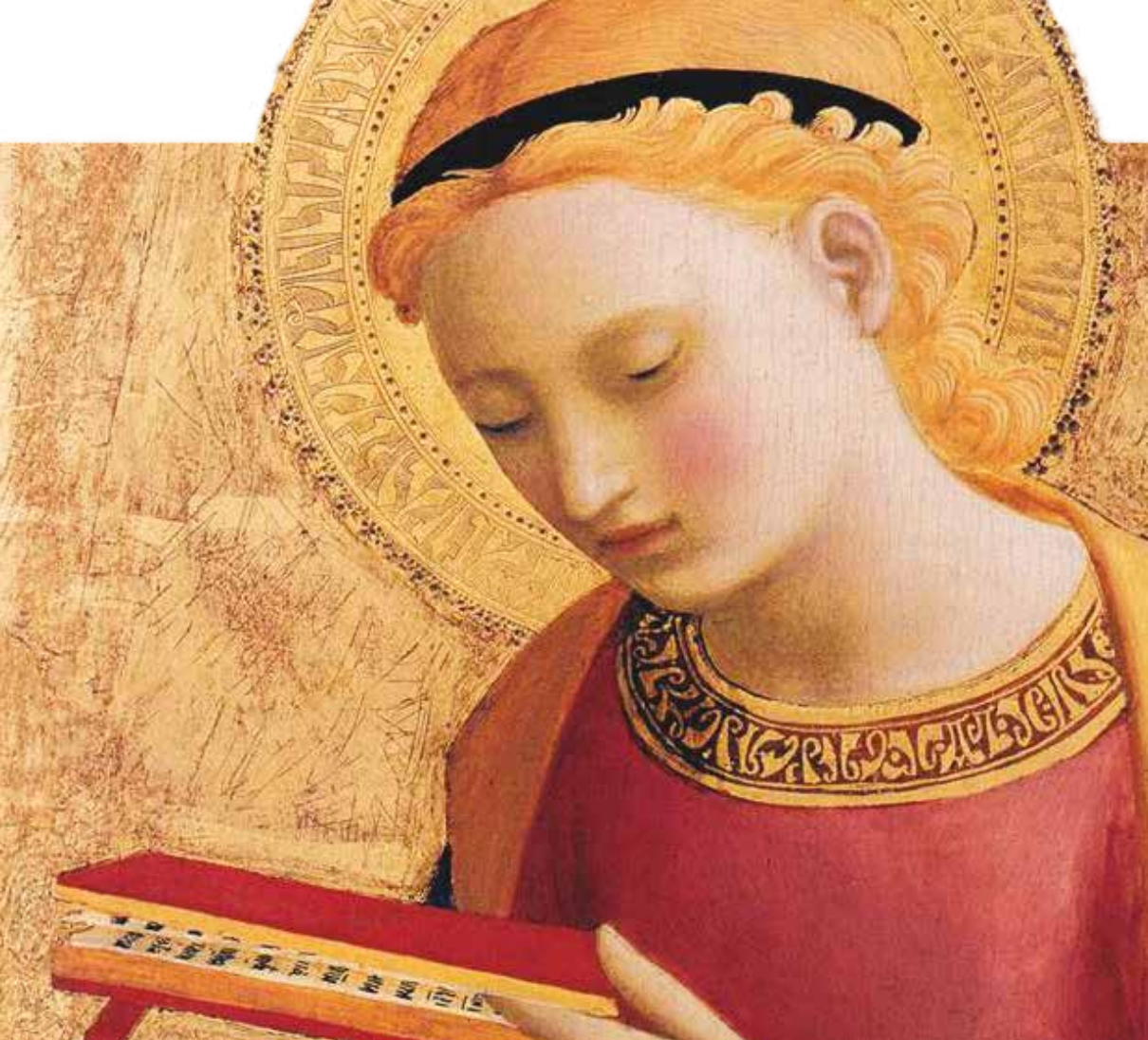
BEATO ANGELICO, Vergine Maria Annunciata , 1431, Detroit (Stati Uniti), Institute of Arts.