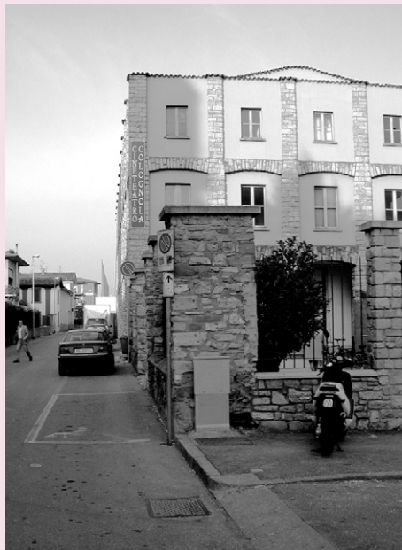
L'ingresso dell'oratorio di Colognola prima della ristrutturazione: l'intero edificio è circondato da un muretto-cancellata che delimita il dentro con il fuori .