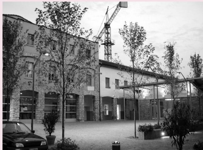
L'ingresso dell'oratorio di Colognola dopo la ristrutturazione: il muretto e la cancellata sono stati rimossi per offrire al quartiere una piazza dove è possibile sostare e incontrarsi sia di giorno che di sera grazie alla curata illuminazione.