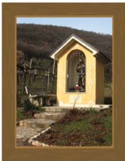
Santella Della Madonna Immacolata