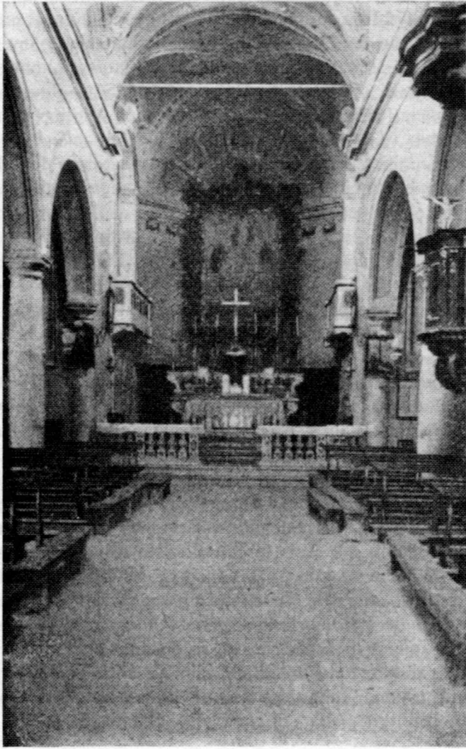
Interno della Chiesa Arcipretale di Saiano.